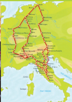
VENERDÌ 4 NOVEMBRE